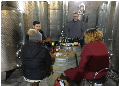
Accord entre le LPA et l'institut de recherche