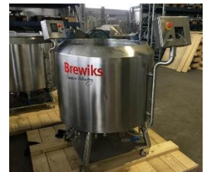
Fabricant industriel de machines agroalimentaires