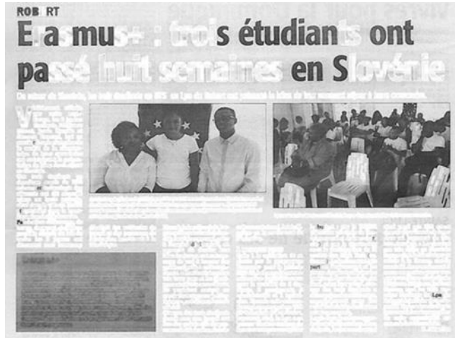
Article du France-Antilles, Vendredi 20 Octobre 2017

Une telle expérience a porté ses fruits. Le développement de savoir-faire, d'autonomie, de responsabilité sont autant d'atouts qui ont permis aux jeunes en formation d'argumenter auprès des entreprises agroalimentaires sur leur plus-value dans le cadre de leur demande de stage pour leur deuxième année de BTS. Cela a été pour certains un atout déterminant pour l'obtention du stage face aux autres candidats avec des perspectives d'embauche. Une étudiante a également pu mettre en avant son expérience européenne lors d'un concours à l'entrée d'une école d'ingénieur qu'elle a d'ailleurs obtenu. Afin de formaliser les compétences transversales acquises et valoriser l'ouverture sur l'extérieur, un supplément au diplôme leur sera délivré.